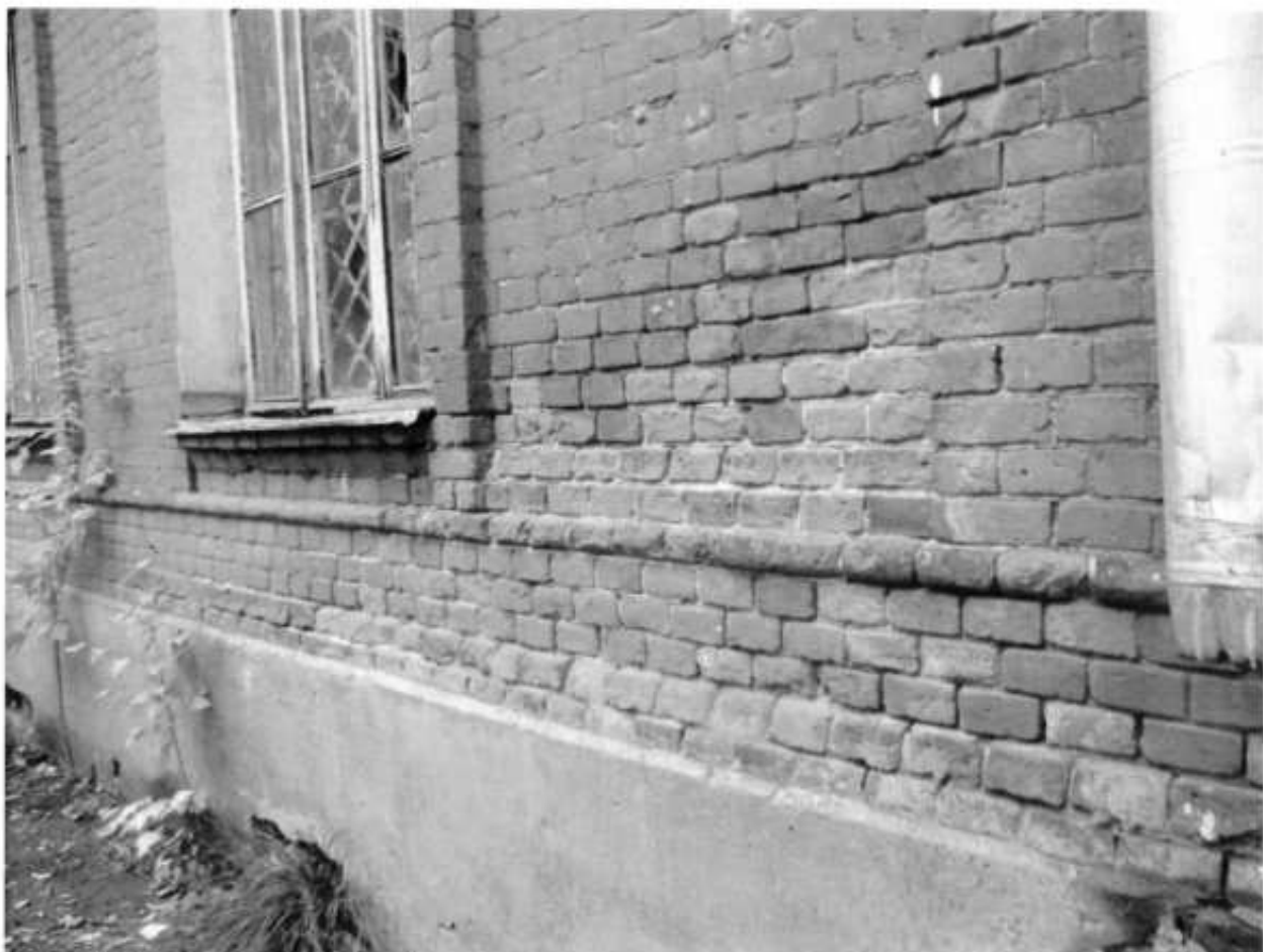
Фото № 7. Фасад, внутренний двор.