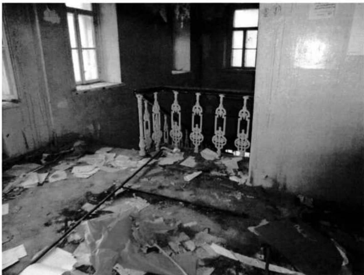
Фото № 11. Парадная лестница.