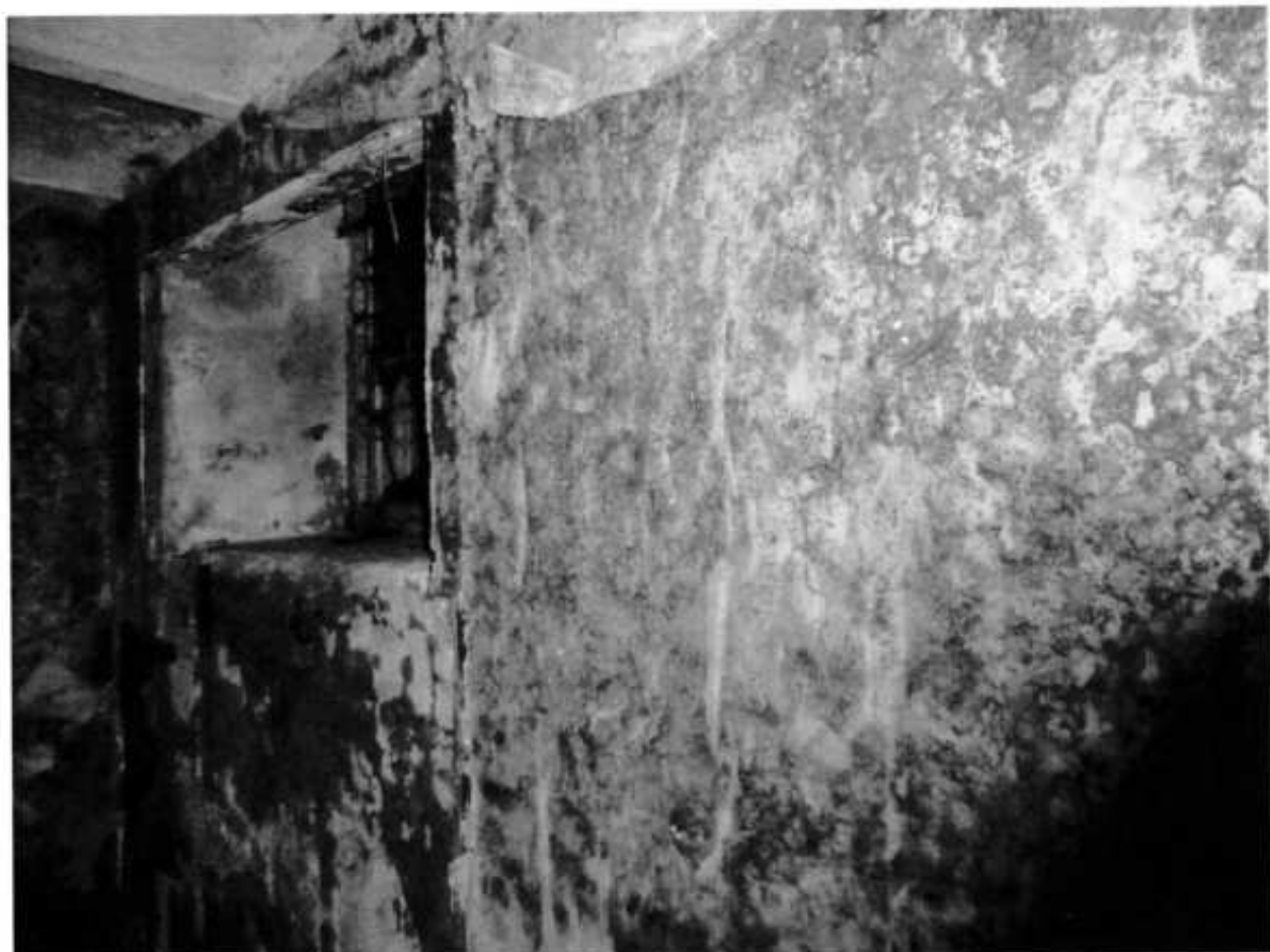
Фото № 9. Помещение подвала.