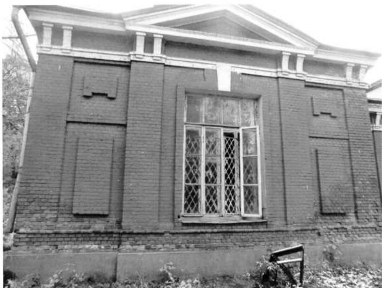
Фото № 5. Боковой одноэтажный корпус.