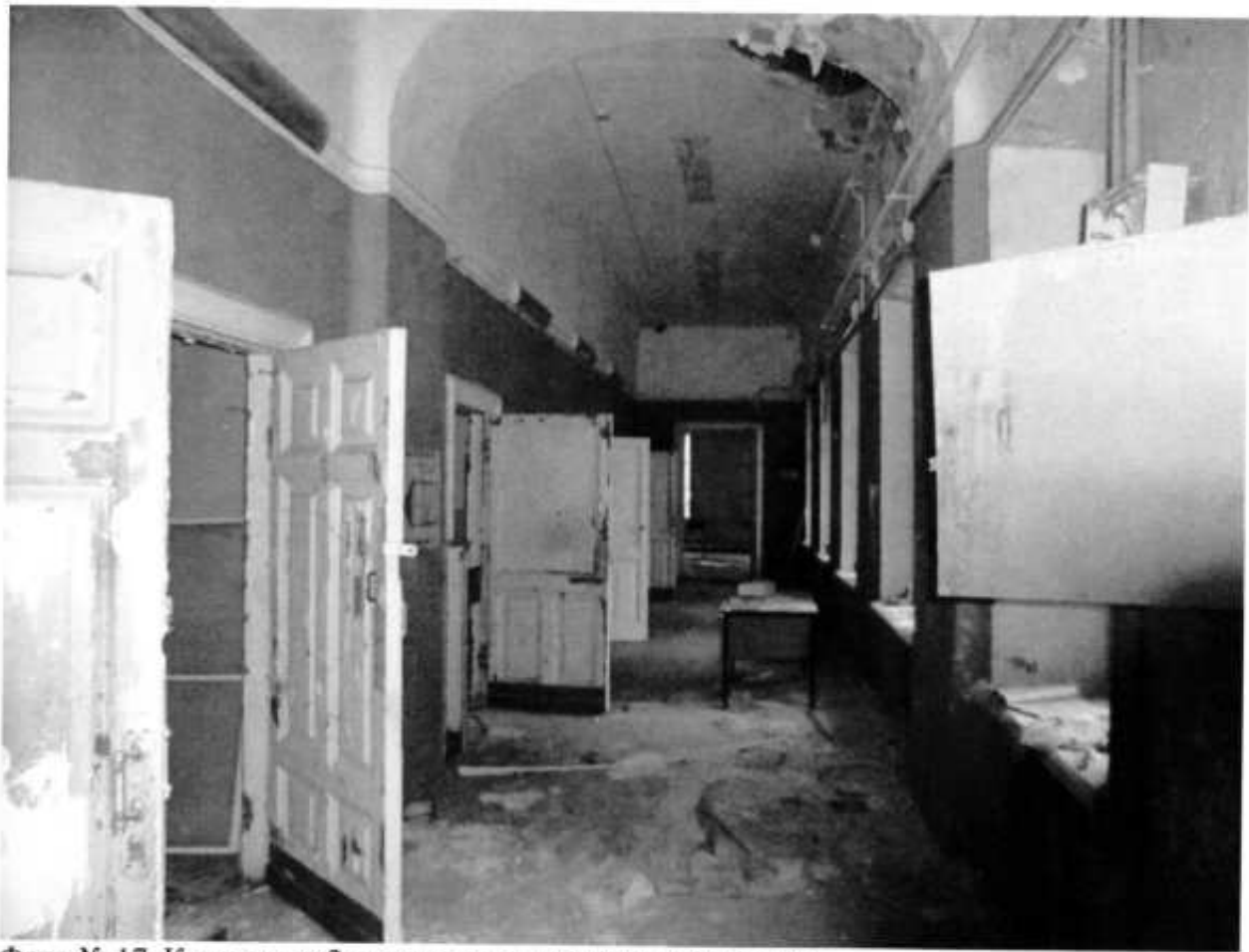
Фото № 17. Коридор из 2 этажного корпуса в одноэтажный.