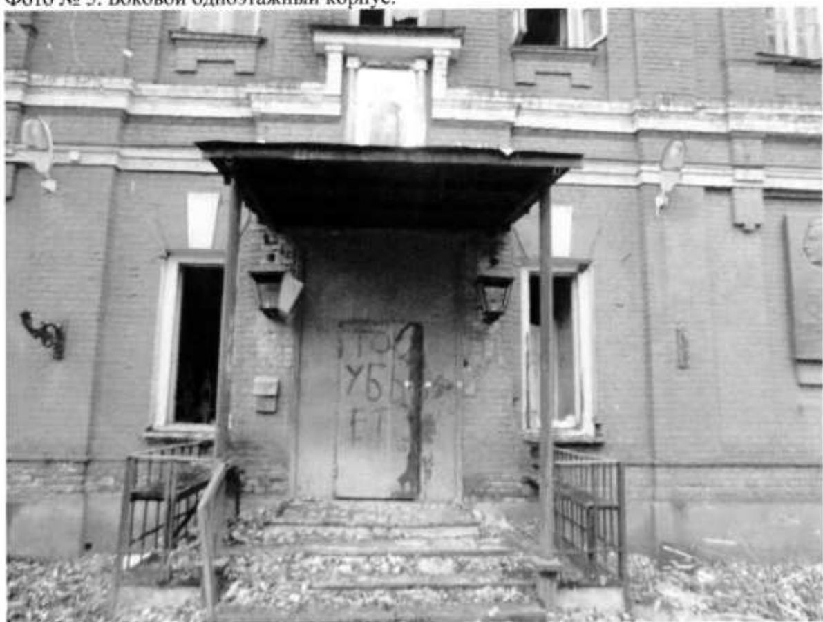
Фото № 6. Главный вход.