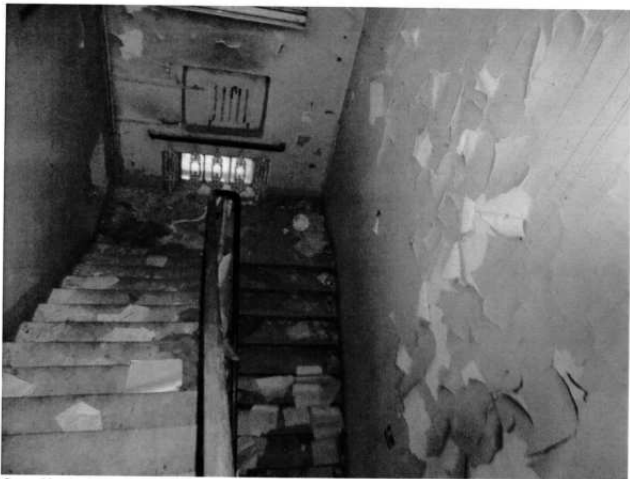
Фото № 13. Служебная лестница.