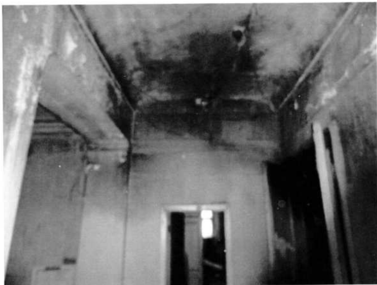
Фото № 15 Перекрытие между 2 этажом и чердаком.