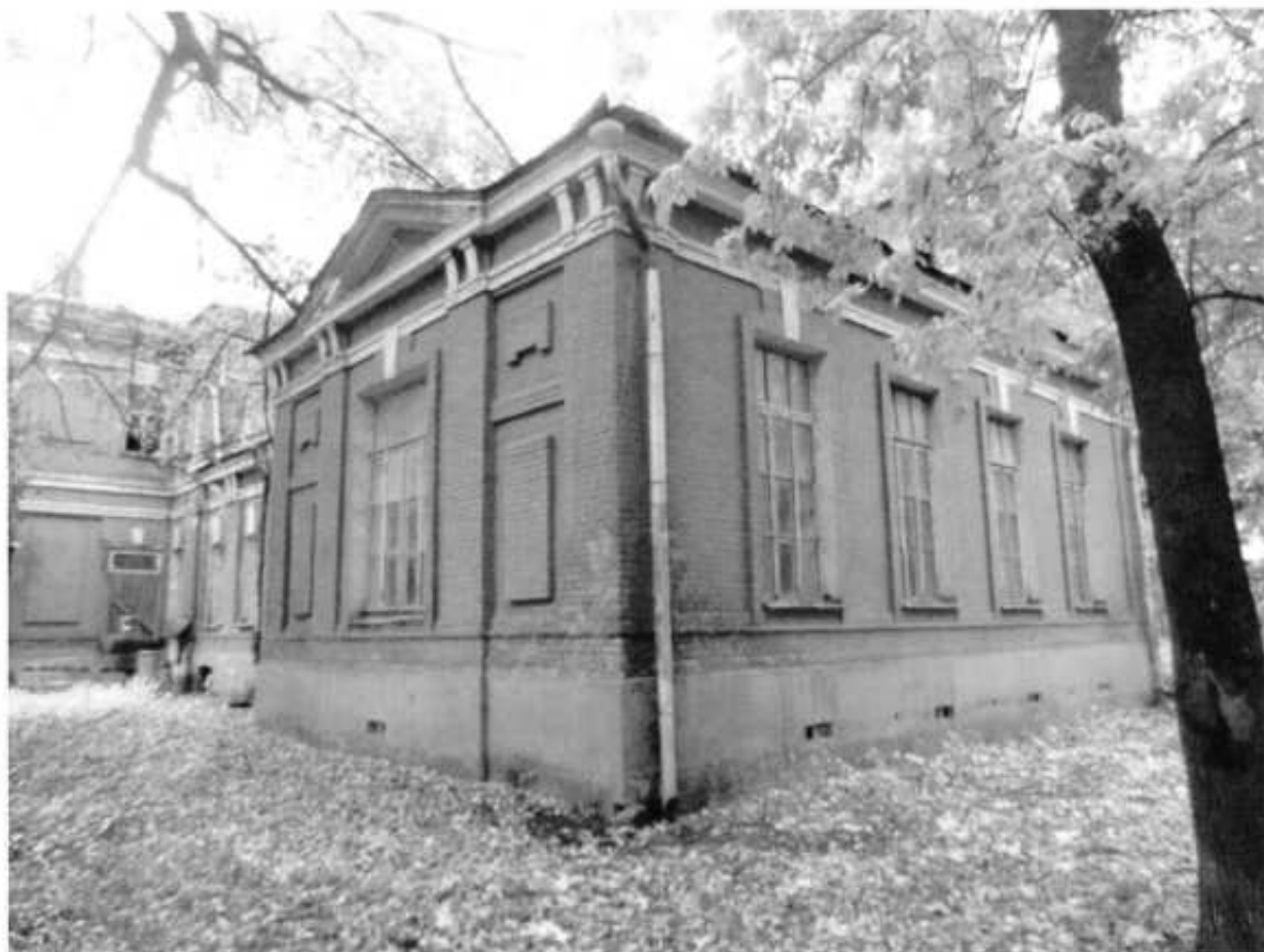
Фото № 3. Боковой одноэтажный корпус.