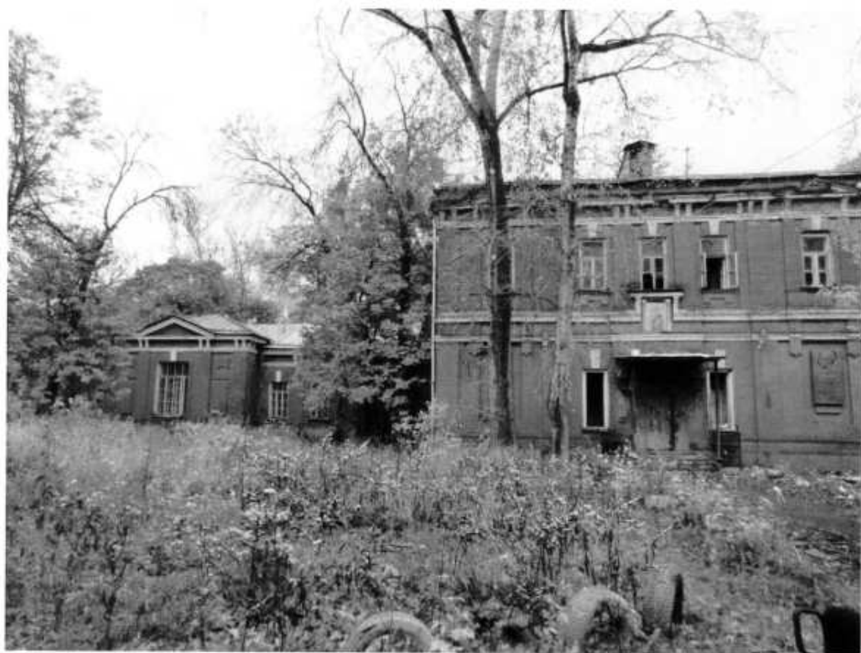
Фото № 1. Фасад со стороны центрального входа.