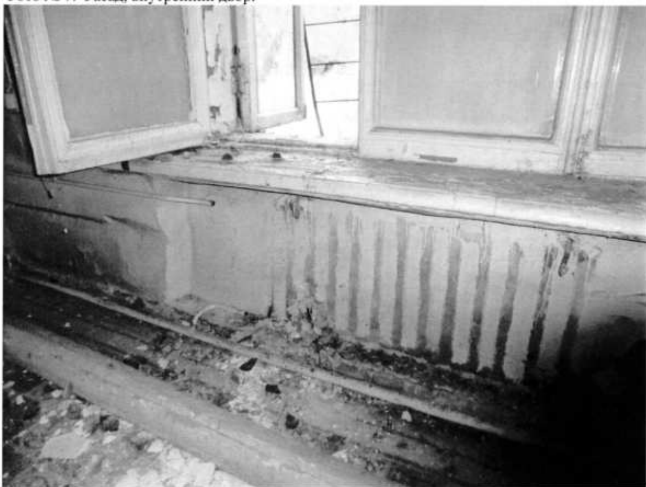
Фото № 8. Помещение одноэтажного корпуса.