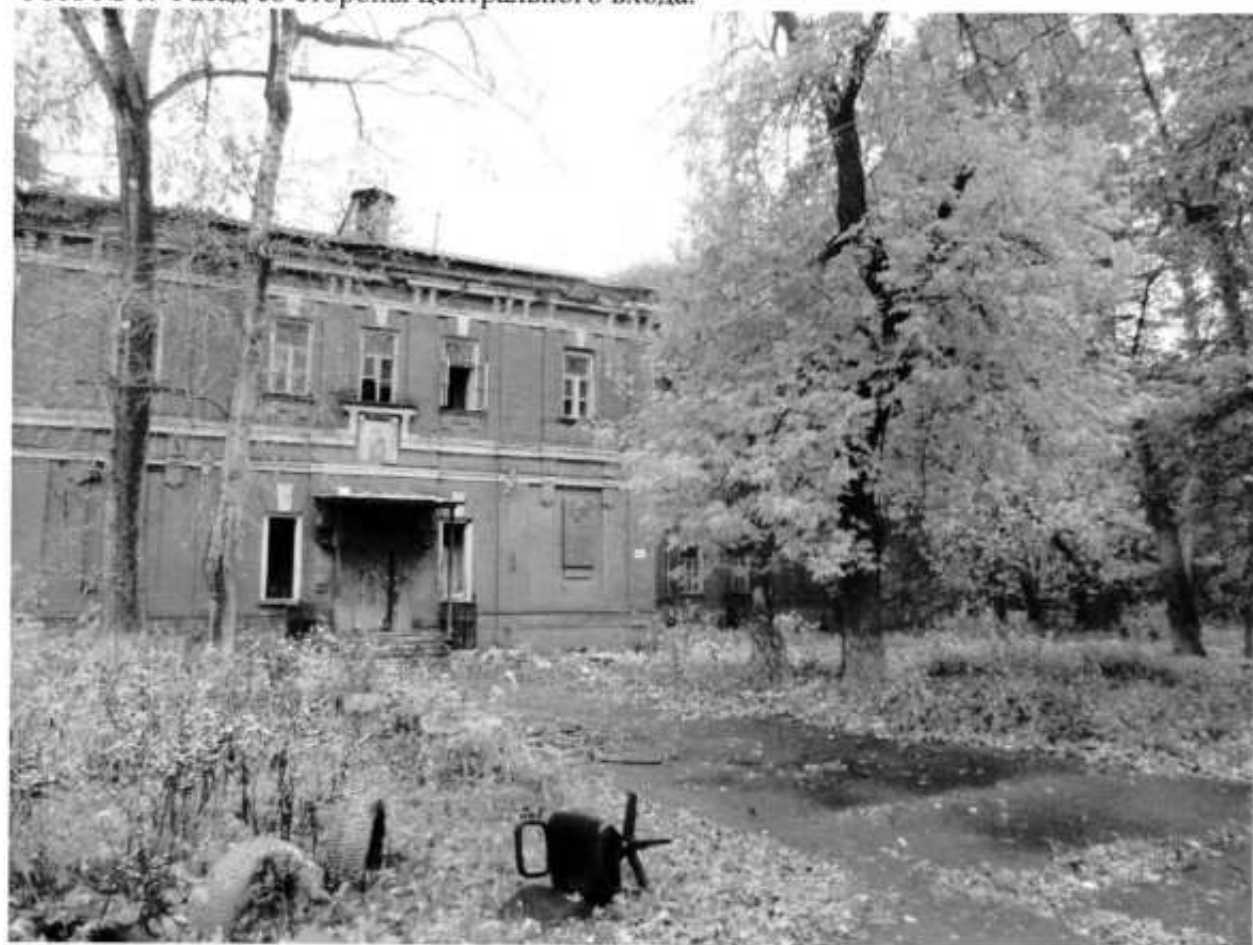
Фото № 2. Фасад со стороны центрального входа.